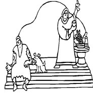
พระเจ้าสถิตกับท่าน คุณพ่อ สมชาย อัญชลีพรสันต์

ใครที่ไม่มิจนกระทั่งให้ความช่วยเหลือผู้ไม่ได้ กำลังกาย กำลังใจ ความหวังโย ความเอื้ออาทร และการ สวดภาวนาให้ ล้วนเป็นการช่วยเหลือ การแสดงความรักต่อเพื่อนพี่น้องทั้งสิ้น ส่วนคนที่ม่ี่ก็ต้องแสดง ความรักความเอื้ออาทรตามความสามารถของตน นักบุญลูกาได้กล่าวถึงการมีโมเสสและบรรดา ประกาศกคอยเตือนอยู่แล้วให้เชื่อฟังคนเหล่านี้ (ลก16:29) ท่านต้องการจะบอกกับเราว่าเราจะต้องทำอะไร ไม่ได้ เพราะพระคัมภีร์และเครื่องหมายแห่งกาลเวลาที่พระเจ้าประทานให้ เตือนใจเราถึงสิ่งเหล่านี้ที่อยู่ เสมอ เราจึงต้องเปิดตาหูเปิดใจฟังคำเตือนสอนของพระเจ้า และปฏิบัติตาม เพื่อเราจะให้มีชีวิตเป็นที่พอ พระทัยของพระองค์.