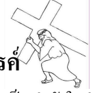
จาก คุณพ่อเจ้าวัด